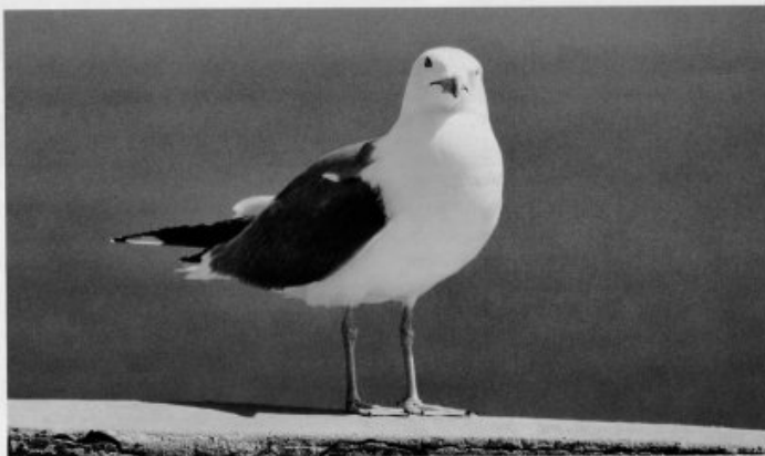
Les oiseaux doivent maintenir une température corporelle qui se situe entre 40 et 44,4° C. C'est la température la plus élevée de toutes les espèces animales.

vu les images de cheval au galop réalisées par l'Américain Eadweard Muybridge, dont il perfectionna le protocole technique. Il est le créateur d'un procédé de prises de vues, la chronophotographie, permettant de décomposer les différentes phases de la locomotion humaine ou animale.